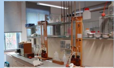
Geochemisches Labor I