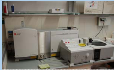
Schlamm- und Sieblabor