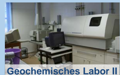
Geochemisches Labor II