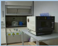
Probenvorbereitung für physikalisch-chemische Untersuchungen: